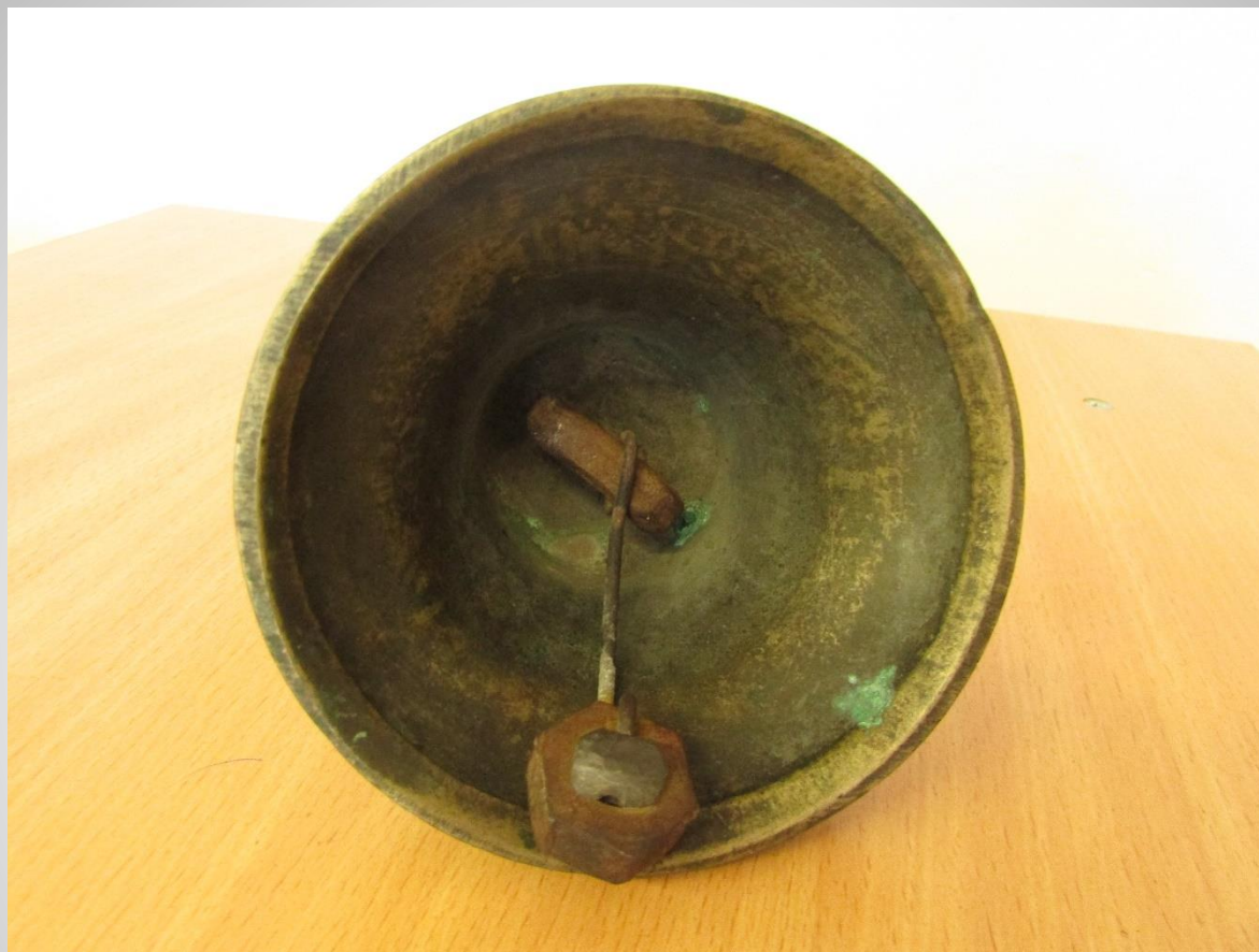
Поддужный колокольчик – экспонат музея МАОУ СОШ №4